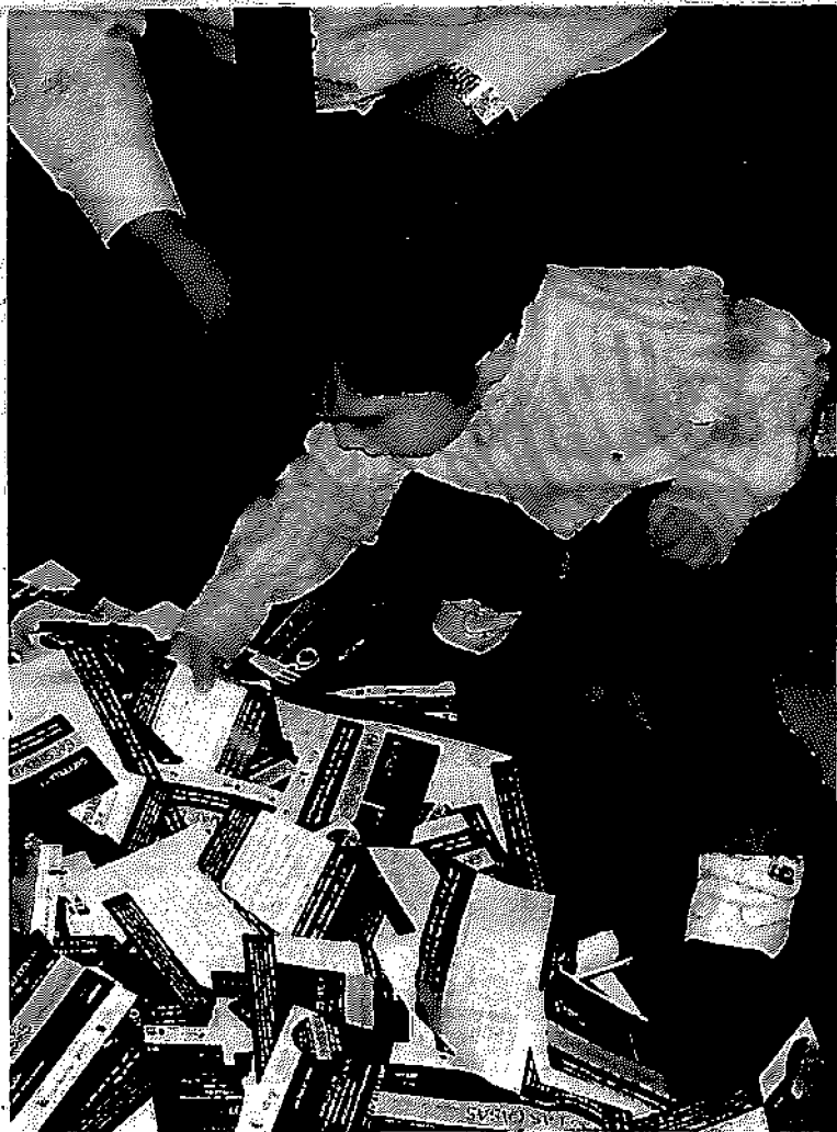
Un niño fue el que sacó la papeleta ganadora de los 10.000 euros.