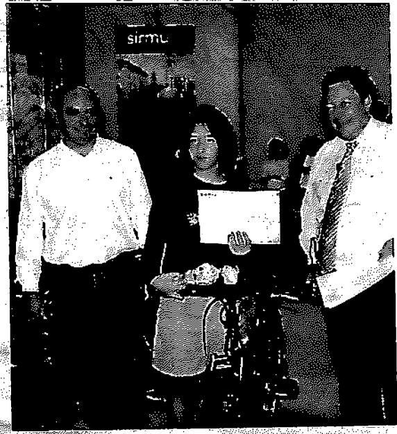
Algunos de los afortunados que recibieron un premio, el pasado domingo, en la clausura del Sirmu.